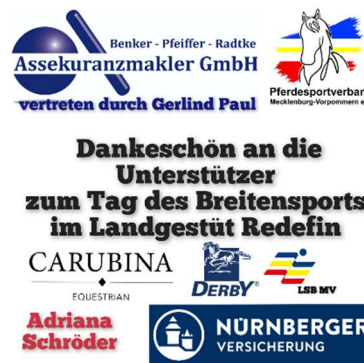
Foto: Impressionen und Unterstützer zum Tag des Breitensports im Landgestüt Redefin 2024

Koper & Klug Sieger beim NÜRNBERGER Führzügelwettbewerb Redefin (Pferdesportverband MV). Der Tag des Breitensports im Landgestüt Redefin bot am 06. Juli nicht nur vielseitige Aktivitäten für Pferdesportbegeisterte, sondern auch eine weitere spannende Qualifikation zum Nürnberger Burgpokal der Führzügelwettbewerb Mecklenburg-Vorpommern. Die Veranstaltung zog eine große Teilnahme an und bescherte den jungen Reitern und Reiterinnen unvergessliche Momente.